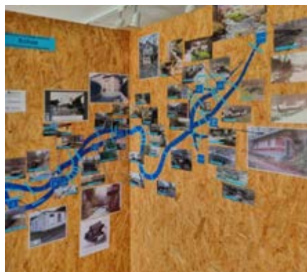
Echazbrücken und -stege