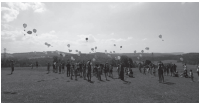
Mehrjährige Blühfläche, Foto: Geschäftsstelle Biosphärengebiet Schwäbische Alb.

Das Kreislandwirtschaftsamt Reutlingen und die Geschäftsstelle Biosphärengebiet Schwäbische Alb informieren am Mittwoch, 27. September 2023 von 17.00 Uhr bis ca. 18.00 Uhr alle Interessierten über Artenvielfalt in der Landwirtschaft. Bei einer Feldbegehung in Münsingen-Auingen beantworten Expertinnen und Experten alle Fragen rund um das Thema „Mehrjährige Blühflächen in der Landwirtschaft“. Der Treffpunkt befindet sich am Sportplatz des SV Auingen in der Egelsteinstraße. Eine Anmeldung ist nicht erforderlich. Bisher erfreuten in der Landwirtschaft vor allem einjährige Blühflächen mit Sonnenblumen und Malven das Auge. Für die Artenvielfalt sind Blühflächen, die auch über den Winter stehen und über mehrere Jahre nicht bewirtschaftet werden, noch interessanter. Diese Flächen sind sehr strukturreich und auf den ersten Blick könnte gemeint werden, dass hier „etwas vergessen wurde“. Doch genau das Gegenteil ist der Fall: Engagierte Landwirtinnen und Landwirte schaffen damit Rückzugsräume für bedrohte Arten. Aus naturschutzfachlicher Sicht sind mehrjährige Blühflächen sehr wirksam. Hintergrund ist insbesondere, dass diese einen vielfältigen Lebensraum für Insekten darstellen und für Feldvögel als Brutgebiet im Frühjahr und als Deckungs- und Futtergebiet im Winter zur Verfügung stehen können. Annegret Schrade vom Kreislandwirtschaftsamt Reutlingen stellt die Maßnahme und die möglichen Blühmischungen am 27. September 2023 am Feld vor. Rainer Striebel und