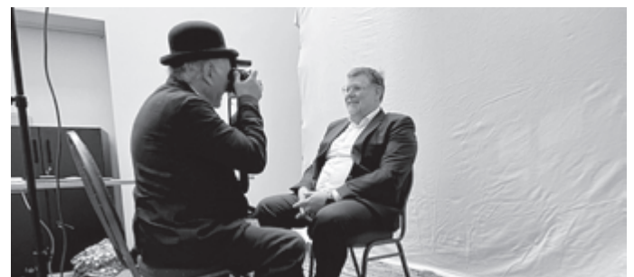
Foto: Landrat Dr. Ulrich Fiedler hat sich am Tag der Kreisgeschichte für das Kunstprojekt „Der Landkreis lächelt“ fotografieren lassen.

Das umfangreiche Programm ist online unter www.kultur-machen.de/kunst-und-kulturmesse abrufbar. Fragen können darüber hinaus per Mail unter kreisarchiv@kreis-reutlingen.de gestellt werden.