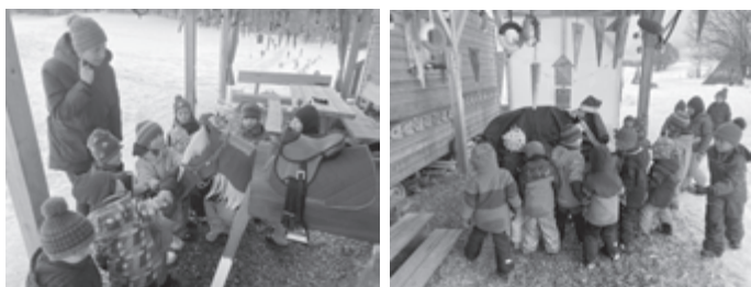
Ein ganz großes Dankeschön an den anonymen Nikolaus