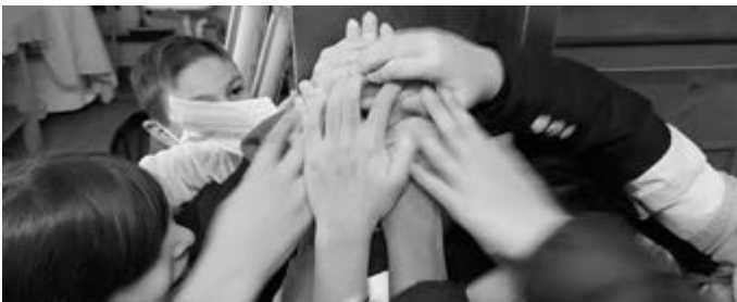
Bildunterschrift: "Gemeinsam schaffen wir es, den Hebel zu drücken, damit der Ofen aufgeht"