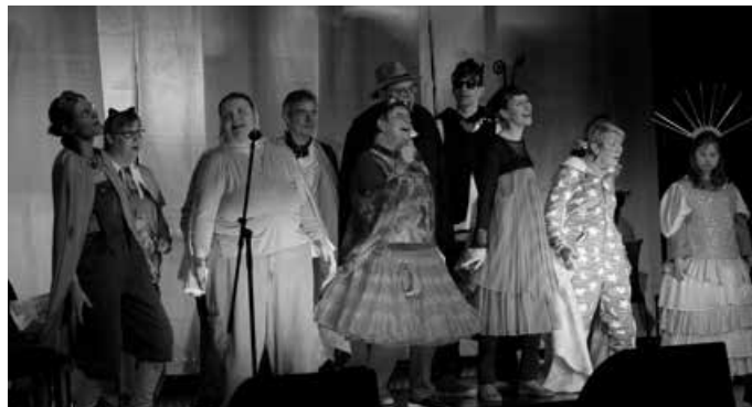
Foto: Die „Superheros“ auf der Bühne des franz. K.