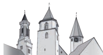
Evangelische Gesamtkirchengemeinde Unterhausen-Honau

am Samstag, den 09.11.2024 von 9.00 - 11.00 Uhr ins Evangelische Gemeindehaus Unterhausen